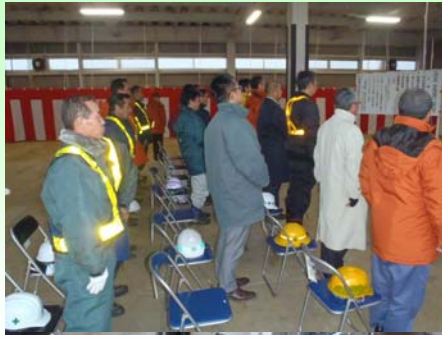
式典には関係者約50名が参列しました