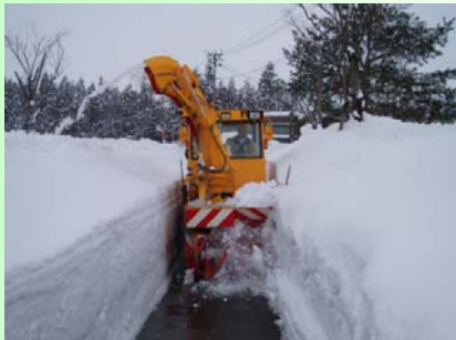
小型除雪車 通学路等において歩道を確保します