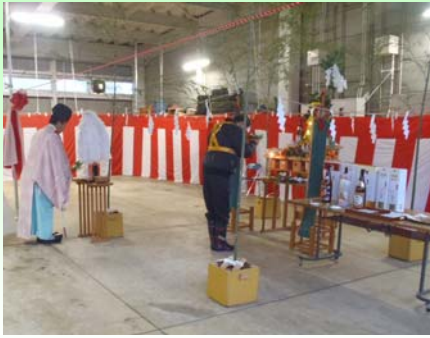
除雪業者が今冬の無事故無災害を祈願しました