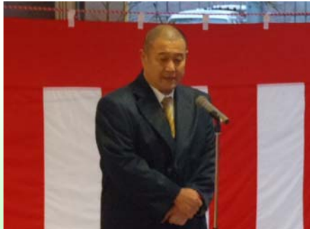
新庄市長 山尾順紀様よりご挨拶を頂戴しました