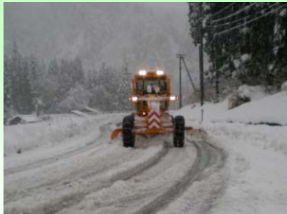
除雪グレーダ 路面にできた圧雪を排除します