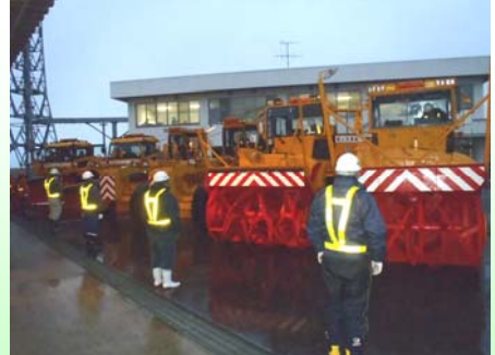
除雪機械のエンジン始動！ 来春までの長丁場をフル稼働します