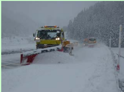
除雪トラック 路面の雪を迅速に排除します

除雪作業時に活躍する除雪機械をご紹介します。様々な種類がありそれぞれに役割があります。