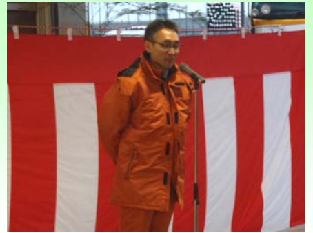
手塚山形河川国道事務所長の挨拶