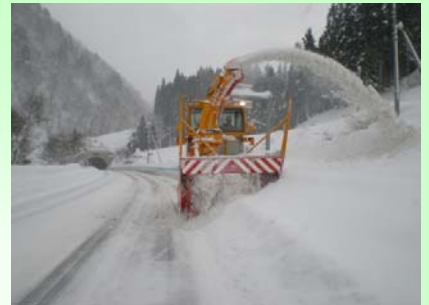
ロータリ除雪車 雪を路外に飛ばし道幅を確保します