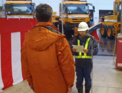
除雪業者の代表者が安全に除雪作業を行うことを宣言しました