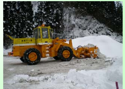
除雪ドーザ 駐車帯等の除雪を行います

今冬も安全で円滑な雪道の交通確保に努めてまいりますので、ご理解とご協力をお願いします。