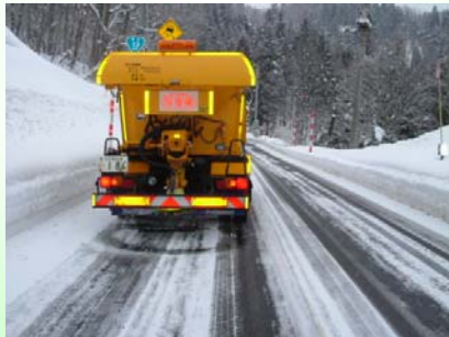
凍結抑制剤散布車 カーブや坂道等に凍結抑制剤を散布します