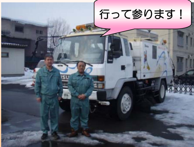
▲作業員2名で宮崎までの運搬作業にあたります