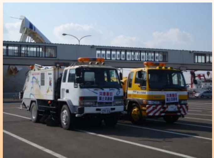
▲仙台港からフェリー等で宮崎へ向かう新庄国道維持出張所配備の路面清掃車(左)