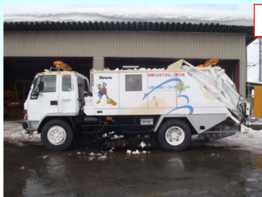
▲新庄国道維持出張所配備の路面清掃車

今回の応援派遣では、降灰により路面標示や区画線が視認できない状況を改善し、道路脇にたまった降灰で二輪車等が転倒する危険性を排除する等の活躍が期待されています。