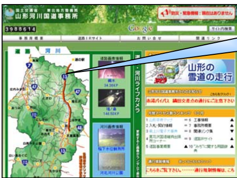
山形河川国道事務所HPトップ

山形河川国道事務所のホームページ及び携帯サイトでは管内国道のライブカメラ画像を30分ごとに更新しておりますので、 路面状況をリアルタイムに確認することができます。