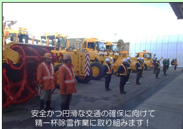
安全かつ円滑な交通の確保に向けて 精一杯除雪作業に取り組みます！

本格的な降雪シーズン到来を前に、11月13日（金）に新庄国道維持出張所管内の新庄除雪ステーションにおいて、安全祈願式祭（維持補修工事受注者主催）、除雪車出動式（出張所主催）を開催しました。