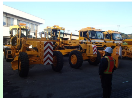
▲「エンジン始動！」の号令で、除雪機械に一齐にエンジンがかけられました