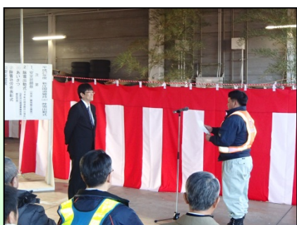
▲「健康で、無事故、無災害で除雪作業を完了できるように、常に心を引き締めて作業します！」

式典では、維持補修工事受注者代表による安全宣言、除雪機械の鍵の引き渡しなどが行われました。