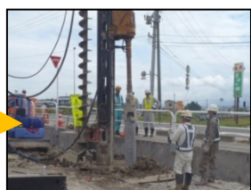
セメントで杭を固定