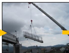
クレーンで吊り上げ