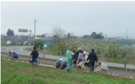
朝6時頃から一斉に開始