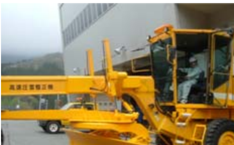
除雪グレーダの運転手になったみたい