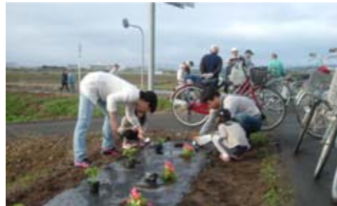
出張所職員も家族で参加しました

5月12日(日)、寒河江市内の国道112号沿いでフラワーロードの植栽が行われました。