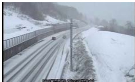
5月7日(火)18:08【月山第1トンネル付近】

5月16日(木)、蔵王一中の2年生3名が月山沢除雪ステーションに職場体験に訪れました。ここは月山道の除雪を行う基地になっており、国道112号の役割や維持管理、冬期間の除雪について学習をしました。