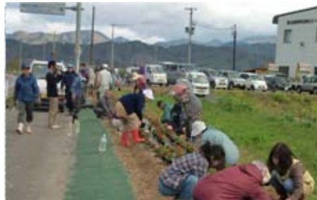
およそ10kmの花の道が完成しました