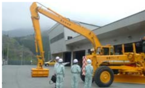
月山道で活躍する除雪機械を学習しました