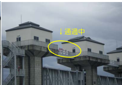
▲普段は入ることの出来ない大旦川水門の施設内部を探検！