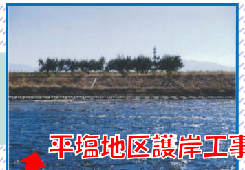
平塩地区護岸工事