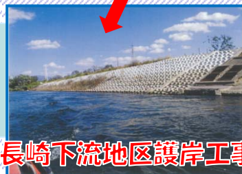
長崎下流地区護岸工事