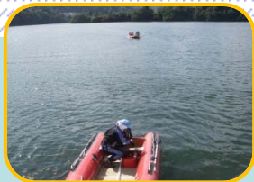
上郷ダムで一旦ボートを引き上げ、大江町へ移動。