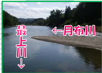
最上川 ← 月布川 最上川