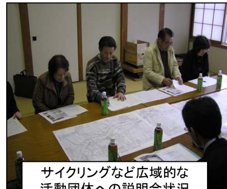
サイクリングなど広域的な活動団体への説明会状況

これまで関係者によるワークショップなどを重ね、合意形成し計画を策定してきましたが、今回の調査により、具体的な図面として示されることとなります。年度内に、測量設計の成果を提示し、最終的な合意形成を行うとともに、高水敷利用と水辺利用・既存施設も含めた須川の全体的な利用ネットワーク形成などについて引き続き話し合いを進めていく予定です。