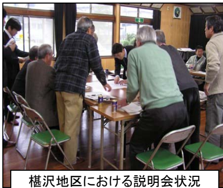
樺沢地区における説明会状況

12月3日～5日にかけて、来年度から着工を予定している「須川かわまちづくり」事業の設計に係わる測量調査のための地元説明会を開催しました。事業範囲が須川の広範囲に及んでいるため、5回に分けての開催でしたが、各会場とも活発に質問や意見が出され、事業に対する期待の高さを感じられました。