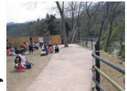
[最上川の河岸沿いに白鷹フットパスを整備]