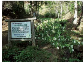
[レーダーに至る道路脇の水芭蕉や黄緑の桜]