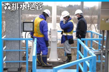
ゲートの開閉に異常がないかと、開閉後の状況も確認しました。

河川の堤防に設置されている施設です。平常時はゲートを開き住宅側の雨水などを河川へ排水していますが、大雨で河川の水位が上がったときはゲートを閉め、住宅側へ水が逆流するのを防ぎます。