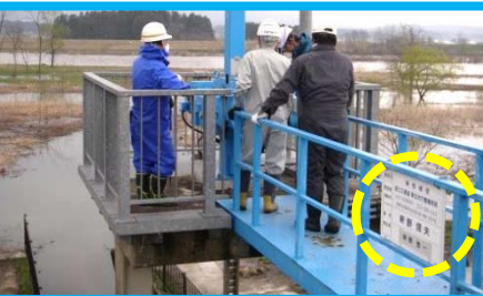
各樋門・樋管には、樋管名等を記載した看板があります。樋門・樋管名がわかると、堤防上での目印になります。