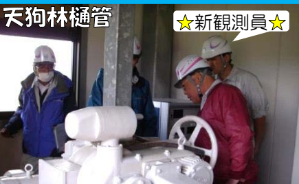
新しい観測員さんも説明をうけ、いざという時に備えています。