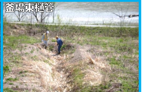
<水路に土砂等が堆積している>