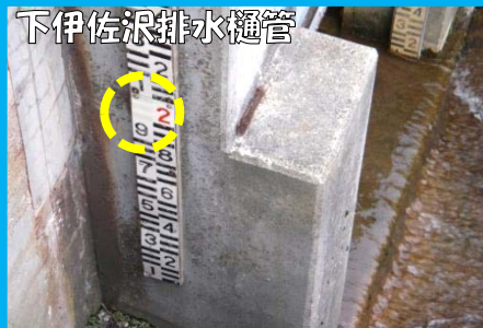
<量水標の目盛がはがれている>