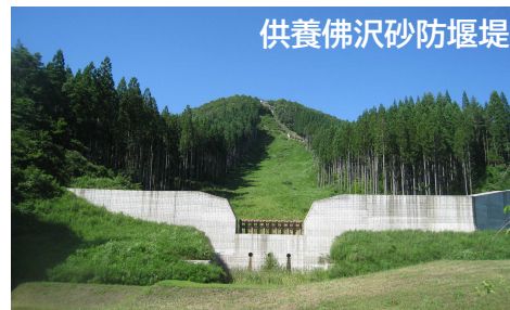
供養佛沢砂防堰堤

7月21日(金)、生保内小学校を会場に「仙北市防災の集い」が開催されます。この企画は平成25年(2013年)8月に仙北市田沢湖先達地区で発生した土石流災害から10年となるのを機に、地元の小学生等を対象に日頃から災害の教訓を風化させないよう防災知識の普及・啓発を図ることを目的に開催されます。湯沢河川国道事務所においても当時の様子や砂防堰堤工事の写真パネル展や災害車両等を展示しますので、一般の方もぜひご来場ください。(主催:仙北市)