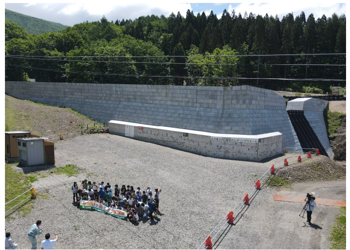
両校で一緒に記念撮影！