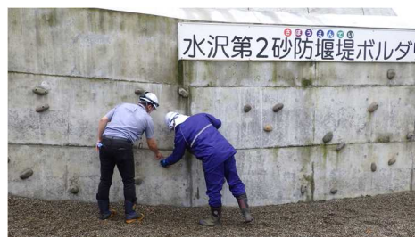
水沢第2砂防堰堤(ボルダリングウォール)

今回の点検において確認された修繕箇所につきましては、既に対応済ですので気軽にご利用下さい！ (各施設へのアクセス方法は当出張所ホームページの「管内の砂防施設」に掲載)