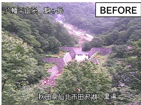
←カメラの上から指示出しをする職員