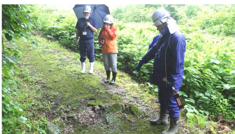
生保内川大暗渠砂防堰堤(癒しの溪流)

7月3日(月)に仙北市建設課・観光課と合同で水辺の安全利用点検を行いました。※今回から新たに水沢第2砂防堰堤(ボルダリングウォール)も点検