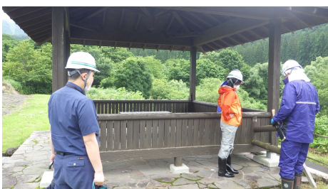
小先達川第1砂防堰堤(サポーター・カルチャーパーク)