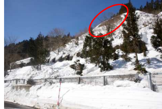
■雪崩発生状況 2月22日