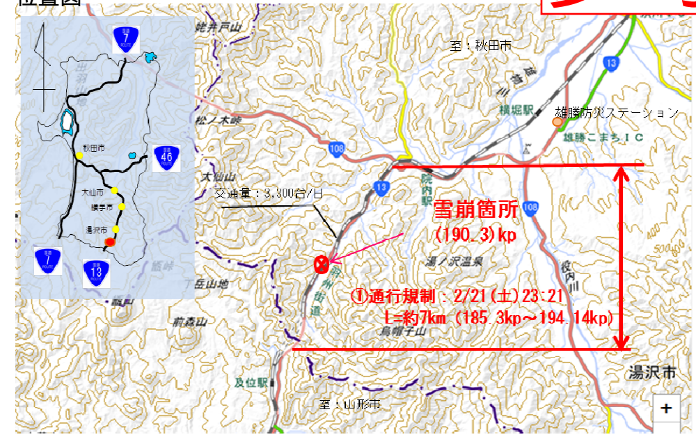
雪崩発生状況(車道) 2月21日