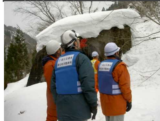
■専門家と職員による確認 2月22日