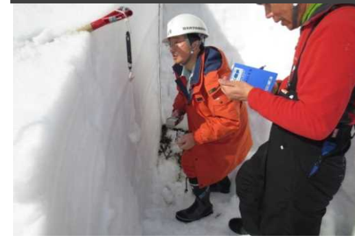
■専門家による調査状況 2月22日