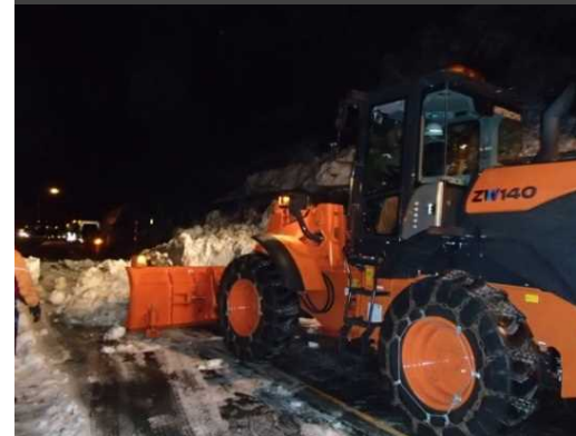
■雪崩処理実施状況 2月22日