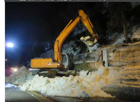
■雪崩処理実施状況 2月23日