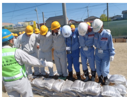
▲高校生と職員による積土のう工の様子