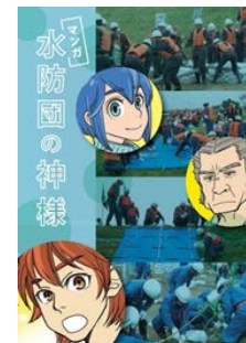
▲防災教育資料として配布した「マンガ 水防団の神様」