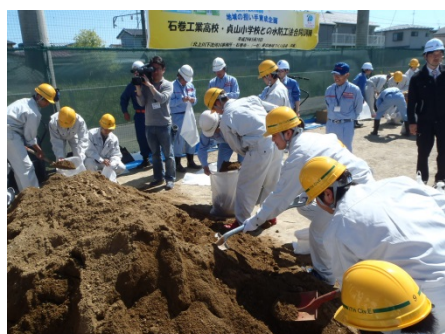
▲高校生と職員による土のう作成の様子