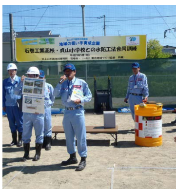
▲訓練概要及び簡易アラート説明