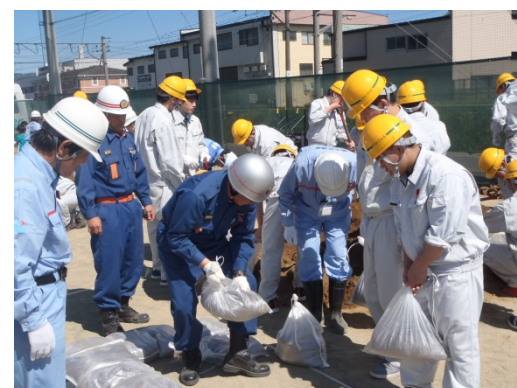
▲石巻市消防団による工法指導の様子