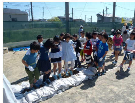
▲小学生による積土のう工体験の様子