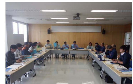
▲石巻地区 意見交換会の様子