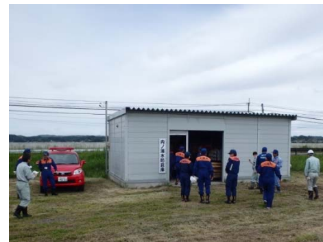
▲吉田川左岸11.0km付近「内ノ浦 水防倉庫」の巡視