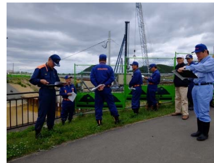
▲旧北上川右岸8.0k付近(水押) 重要水防箇所の巡視