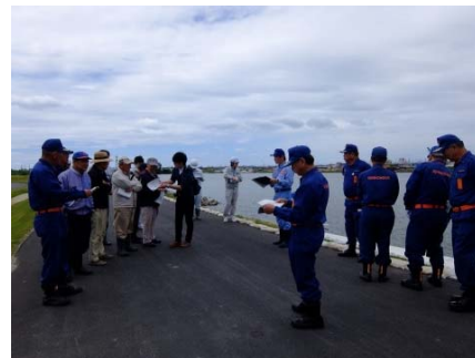
▲旧北上川左岸9.0k付近(大瓜) 重要水防箇所の巡視