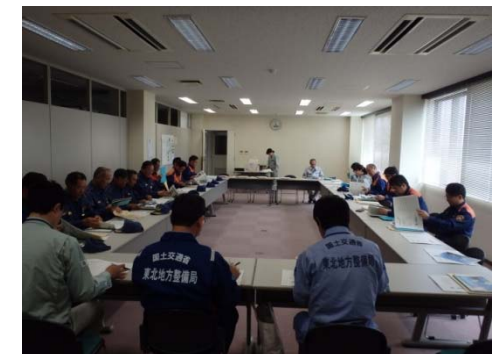
▲鹿島台地区 意見交換会の様子