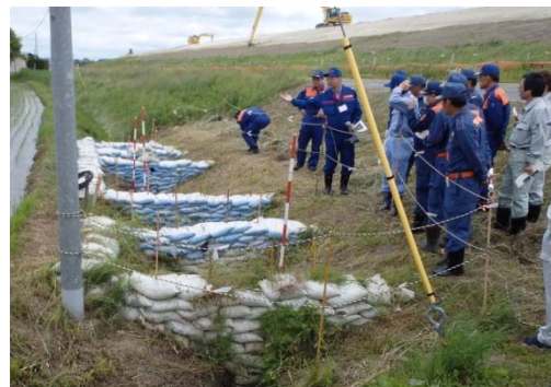
▲鳴瀬川右岸11.7k付近（木間塚） H27.9.11漏水箇所巡視