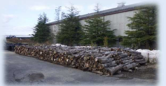
伐採木仮置き状況(昨年度の状況)