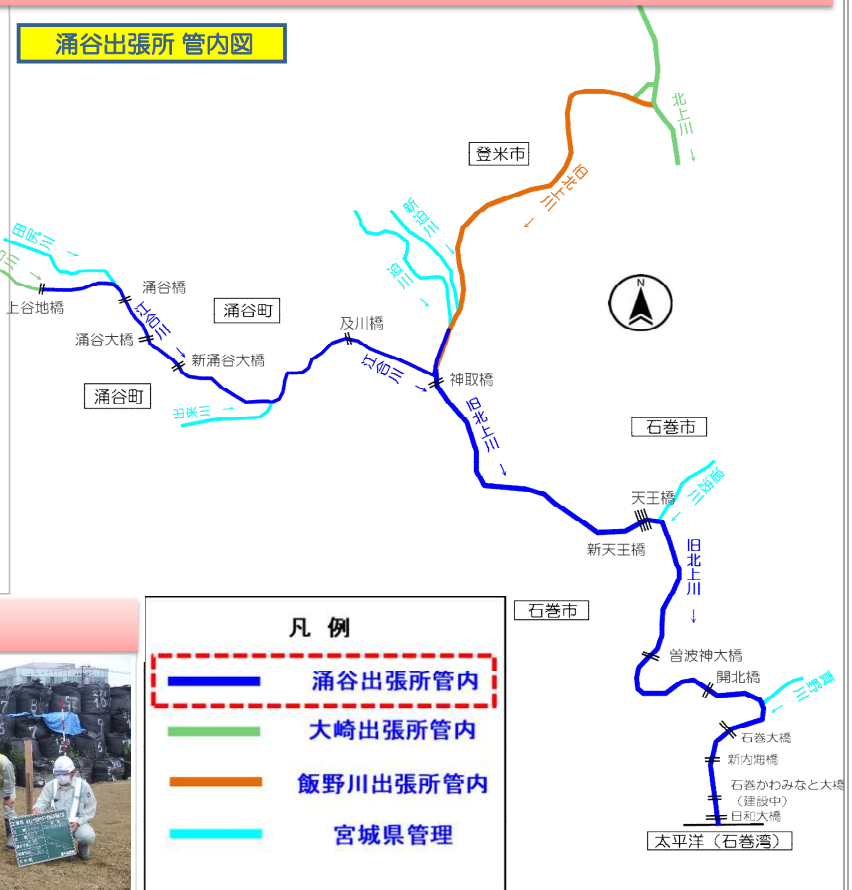
涌谷出張所管内図