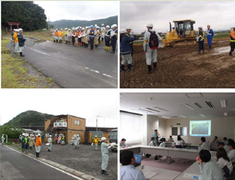
安全パトロールの実施状況

また、前回の安全パトロールから引き続き、女性ならではの視点から建設現場を改善することを目的に、施工業者等から女性社員8名が参加し、安全面や衛生面についての確認・意見交換が行われました。