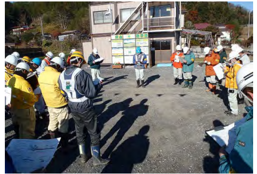
パトロール実施状況

鳴瀬川水系の出張所（鳴瀬・鹿島台・大崎）で監督する全ての工事現場の責任者が集まり、現場の事故を無くすためのパトロールと検討会を行いました。本年も事故が無いよう、安全に工事を進めます。