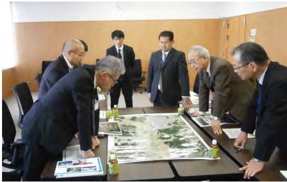
大和町との意見交換会

甚大な被害を被った昨年の関東・東北豪雨を踏まえた「避難を促す緊急行動」の一環として、洪水により堤防が決壊した場合に住民を避難させるための洪水情報や被害想定等について、自治体や水防団の方々と意見交換を行いました。