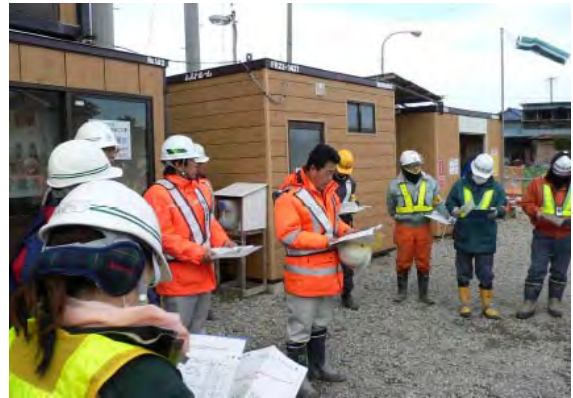
←パトロールのようす

1月14日、鳴瀬川水系の出張所（鳴瀬・鹿島台・大崎）で監督する全ての工事現場の責任者が集まり、 現場の事故を無くすためのパトロールと検討会 を行いました。