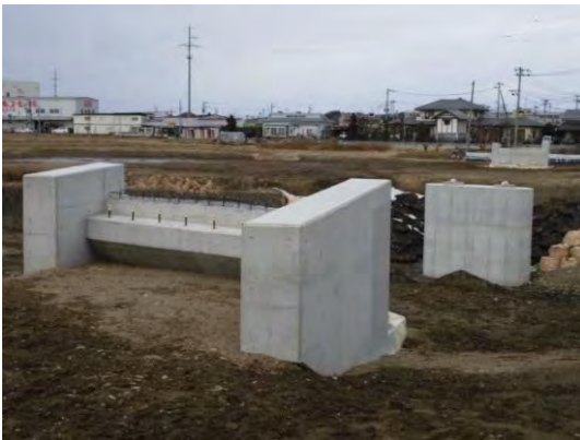
←下部工が完成した北河原橋

今後は上部工（橋桁）の工事を行う予定です。引き続き、ご協力をよろしくお願ひします。