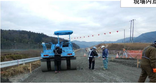
現場内点検の様子

安全な工事現場となるように、意見交換で指摘された改善点等の対策を行いながら、無事故での工事完成に向けて取り組んでいきます。