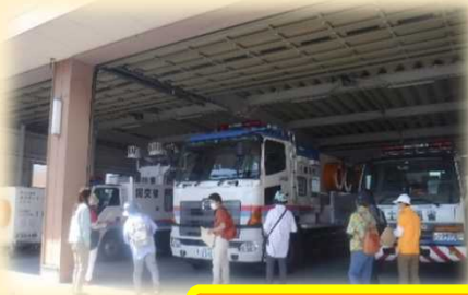
排水ポンプ車を間近で見学

9月末日、鹿島台周辺にお住まいの方々15名が、鹿島台出張所の見学に来所されました。2班に分かれて、出張所の仕事内容や、二線堤のお話を真剣に聞いてくださいました。