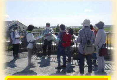
見晴らし抜群の屋上から