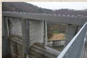
▲間近に見る常用洪水吐は すごい迫力！

今回の調査は、コロナ禍に休止していて今年度から復活した『ダム堤体見学 一周コース』に同行させていただきました。見学予定時間は1時間20分。さあ、どんな見学会になるのでしょうか？ いざ現場へ！！