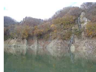
⑥法面の状態も確認します