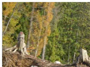
③サルに遭遇しました