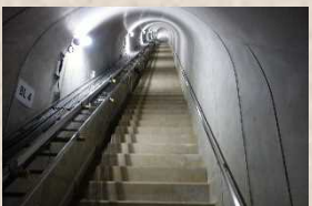
▲急な階段を上り下り