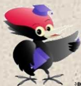
津軽ダム イメージキャラクター ベッカー君