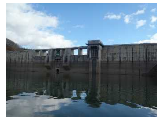
⑦津軽ダム堤体(上流から)