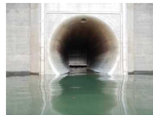
⑧コンジットゲート導流管