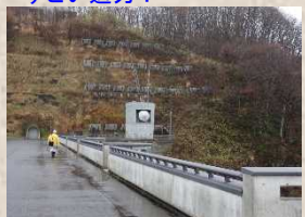
▲通信局舎(筒状の建物)か ら堤体内に入ります。