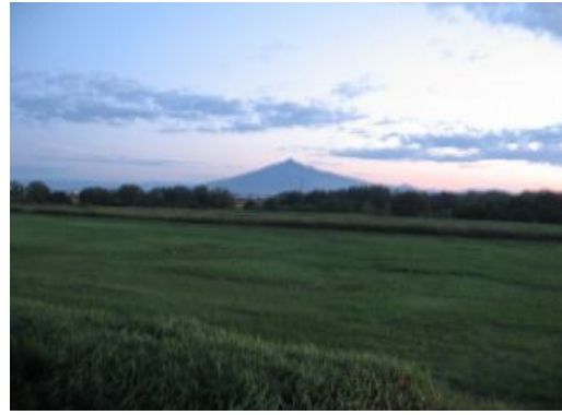
18:20三好橋右岸付近から見た岩木山。