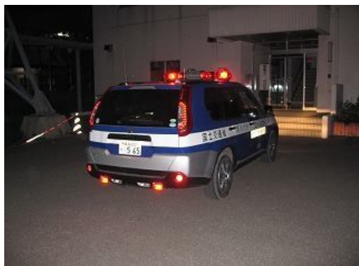
20:20 パトロール終了です。

今回の夜間巡視で、暗闇の中、堤防道路を散歩している人を何人か見かけました。「秋の日はつるべおとし」の言葉どおり、日が暮れるのが非常に早くなっております。 足を滑らして堤防の下に落ちていかないように、十分注意を払っていただきたいです。また、「反射材」を身につけ、周りに早めに認識させ、事故に巻き込まれないようにしましょう。