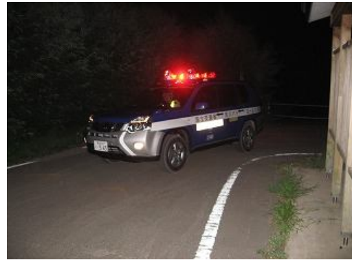
19:50 柏わんぱく広場での巡視の様子