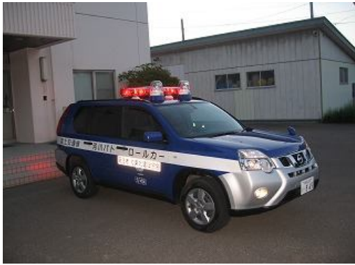
18:00 夜間巡視スタートです。