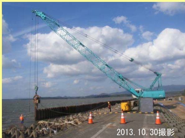
▲ 仮設鋼矢板設置作業の様子