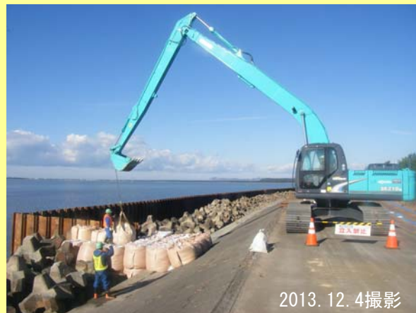
▲ 切端部に土のうを設置して仮締切完了