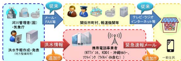
「洪水情報のプッシュ型配信」イメージ

（NTTドコモ、KDDI・沖縄セルラー、ソフトバンク（ワイモバイル含む））のユーザーを対象