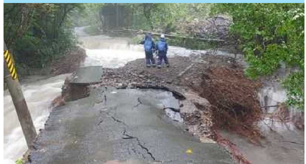
令和4年8月 前線停滞による豪雨 TEC-FORCEによる被災状況確認(深浦町)