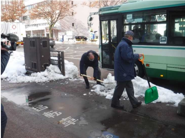
バスの乗降箇所で雪かきの様子