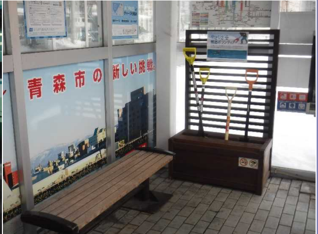
青森市役所前バス停でのスコップ設置

あおもり雪国懇談会では、「雪みち観察隊」の活動で、平成17年度から「バス停オアシス化計画」として、バス停の待ち時間に誰でもボランティアで雪片付けができるようにと、融雪歩道沿いのバス停にスコップを設置する活動を行っています。