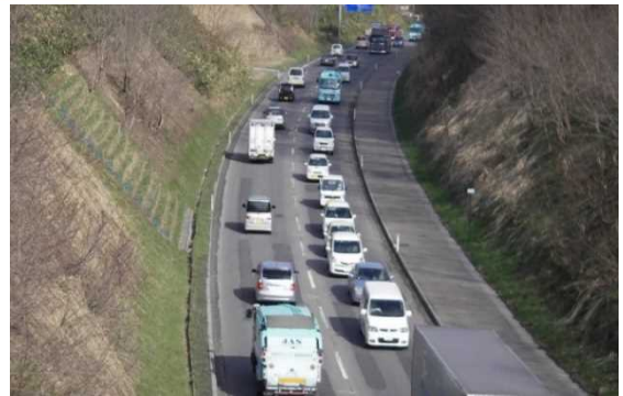
【整備前】 慢性的に渋滞が発生

この事業は、付加車線整備及び交差点改良(右折レーン延伸等)により、交通事故の削減及び交通の円滑化を図るもので、令和4年3月22日より供用を開始しました。