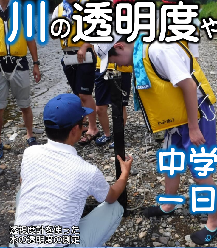
透視度計を使った水の透明度の測定