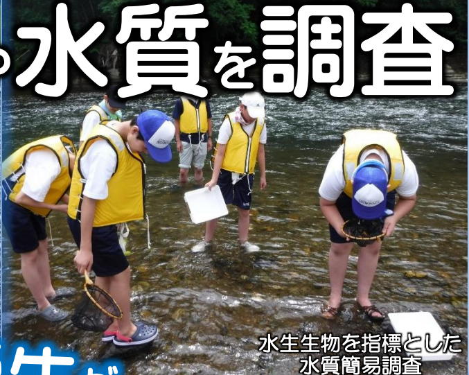
水生生物を指標とした水質簡易調査