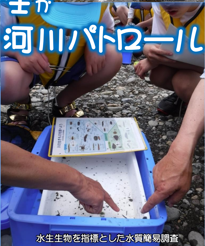
水生生物を指標とした水質簡易調査

7月30日(火)、河川愛護月間(7月)の啓発活動の一環として、八戸市立下長中学校の科学部員10名及び同市立第一中学校の科学部員7名に参加いただき、馬淵川一日河川パトロールを行いました。