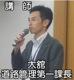
大館 道路管理第一課長

7月19日(金)、「青森県行政書士会 青森支部」の皆さん22名が、青森市のアウガ5階(青森県男女共同参画プラザ研修室)にて「青森河川国道事務所の業務概要と道路占用について」と題した出前講座を受講しました。