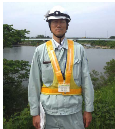
藤崎出張所 千葉 管理第一係長

「本格的な河川の洪水期を前にし、各施設管理者と共に、現地で施設の点検及び洪水時の対応や連絡体制の確認を行いました。