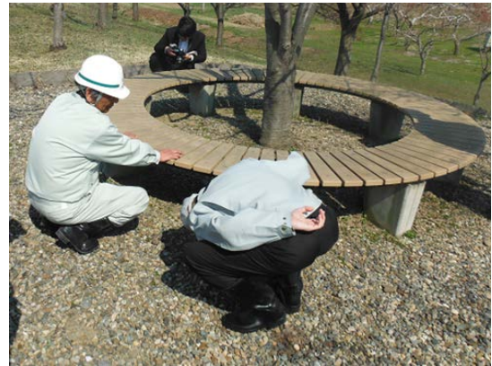
岩木川での点検の様子 城北桜つつみ公園(弘前市)