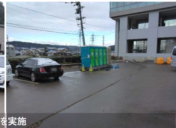
輪島市内における応急仮設住宅の水道施設調査を実施