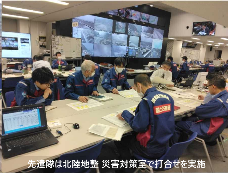
先遣隊は北陸地整 災害対策室で打合せを実施