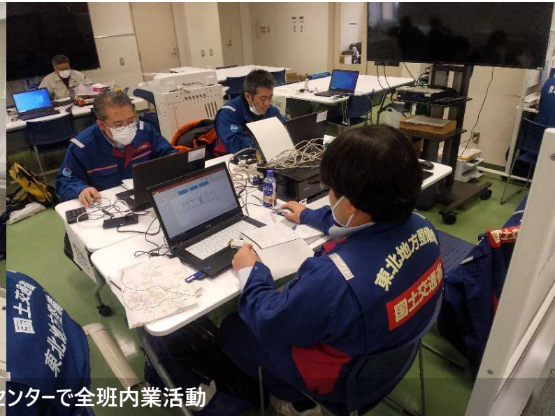
道路班は富山防災センターで全班内業活動