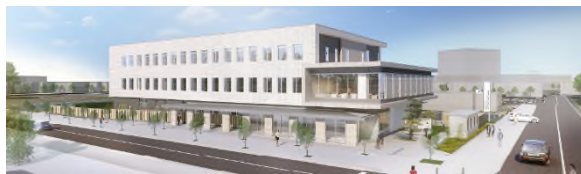
設計デザインのVR化の例

○将来の就職先を検討している理系の学生に、官庁施設づくりに携わっている公務員（国土交通省）や民間企業の仕事内容や役割を説明します。