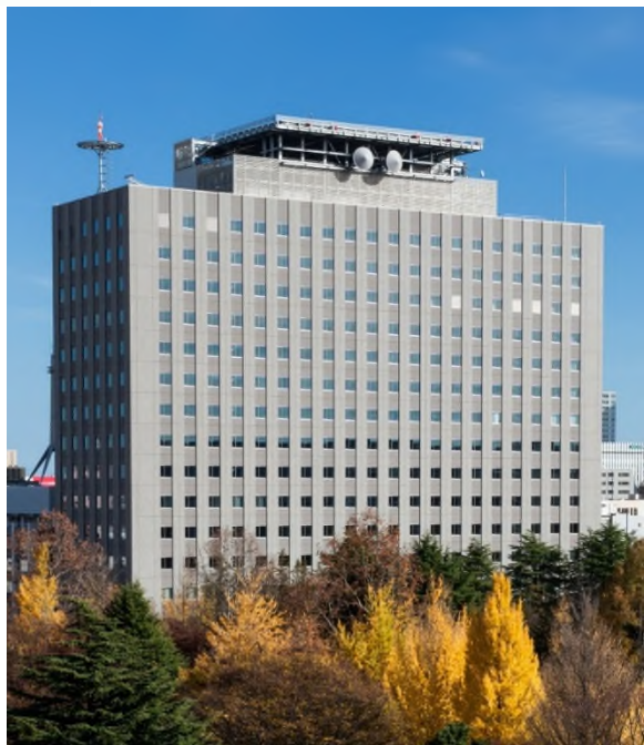
整備事例（仙台合同庁舎B棟）（勾当台公園前）