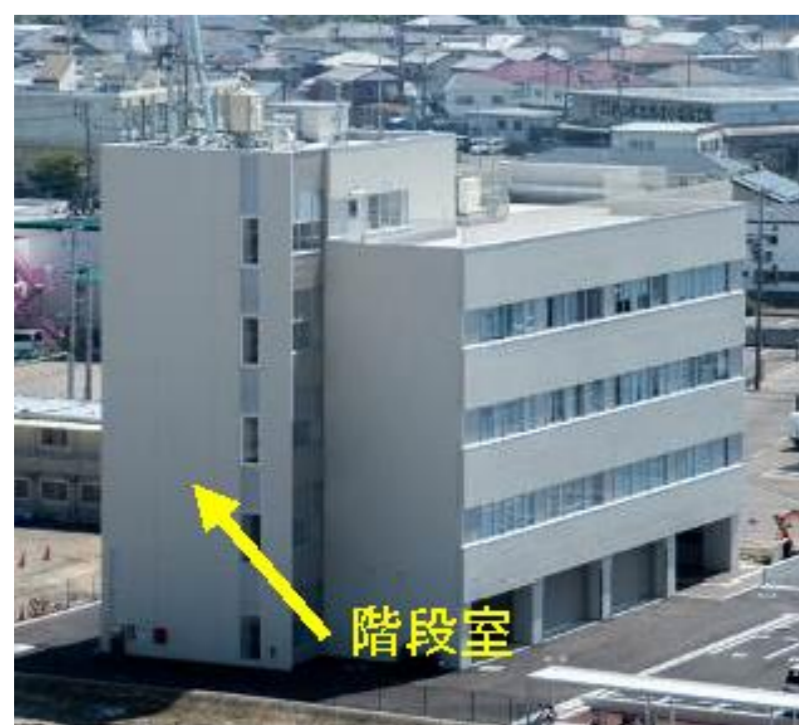
[南西外観（避難ルート階段室）]