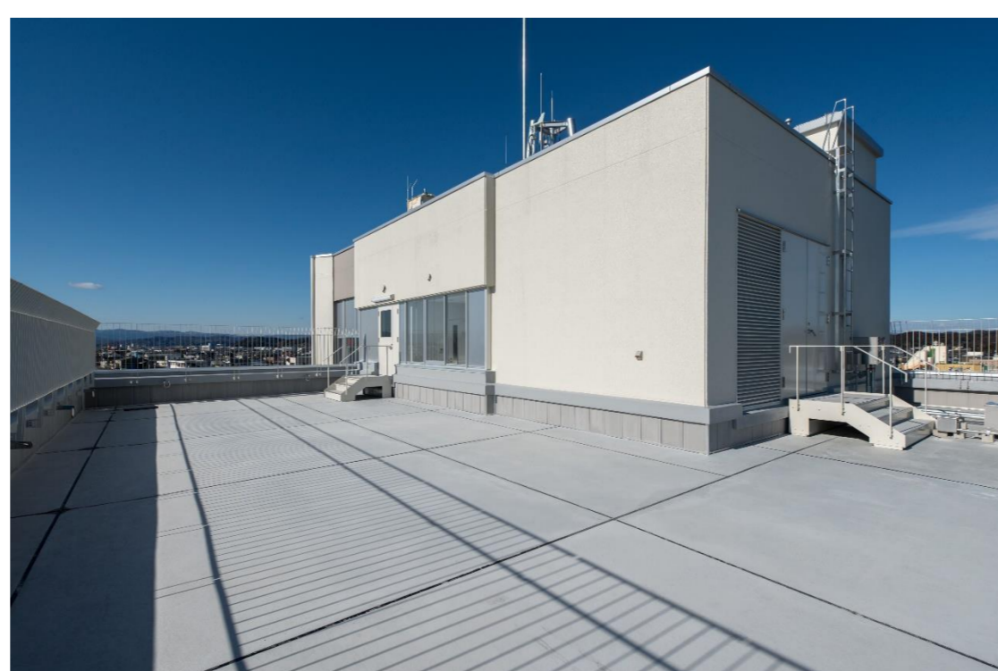
[屋上（避難スペース）]