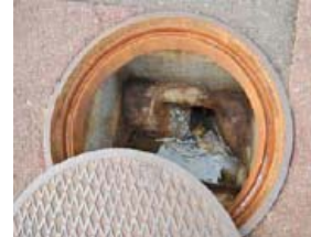
汚水樹の詰まり (例)