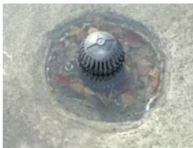
ルーフドレインの詰まり (例)

※特に台風シーズン前には屋上及び屋外の雨水排水経路全体を点検して、突発的な大量の排水にも対応できるようにしておきたいものです。