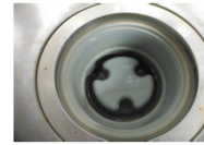
Wトラップ (流し台の排水などに設置)