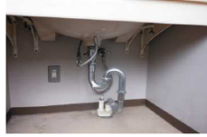
Sトラップ (洗面所の排水などに設置)