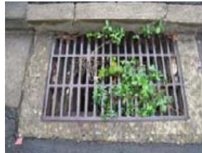
雨水樹の詰まり (例)