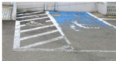
【路面塗装表示の損耗】