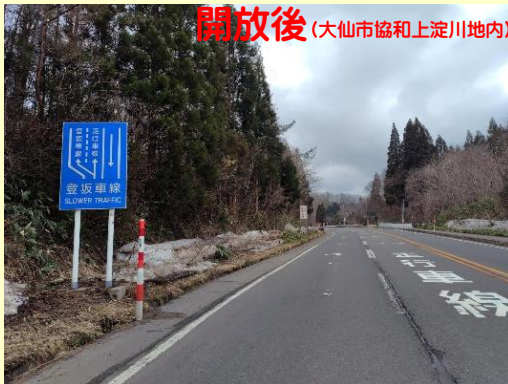
開放後(大仙市協和上淀川地内)

春が近づいてきましたが、まだ降雪や路面凍結は予想されます。夏タイヤへの履き替えはもう少しお待ちいただき、安全運転をお願いいたします。