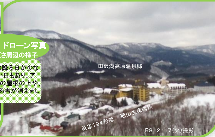
田沢湖高原温泉郷