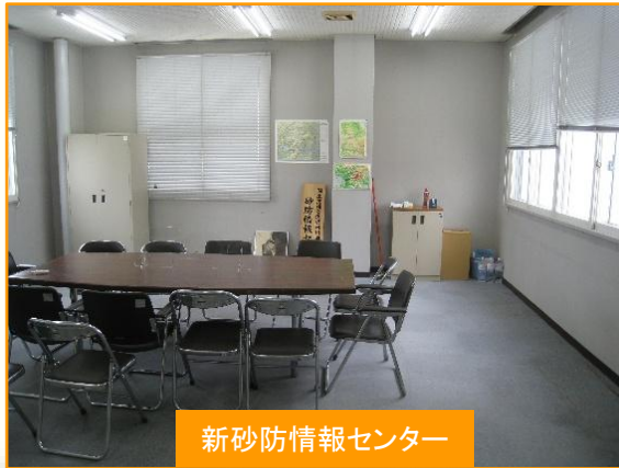
新砂防情報センター