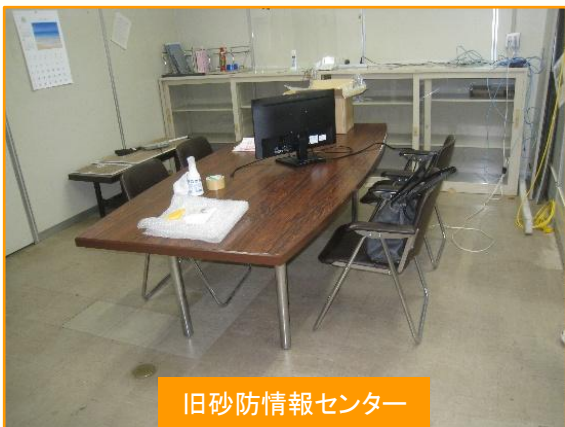
旧砂防情報センター

砂防情報センターが田沢湖第2庁舎から田沢湖庁舎3階に移設になります。移設に伴い備品等の移設作業を3月3日(火)に出張所の職員で行いました。