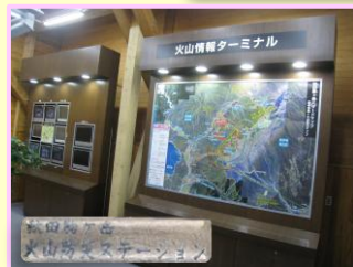
火山情報ターミナル