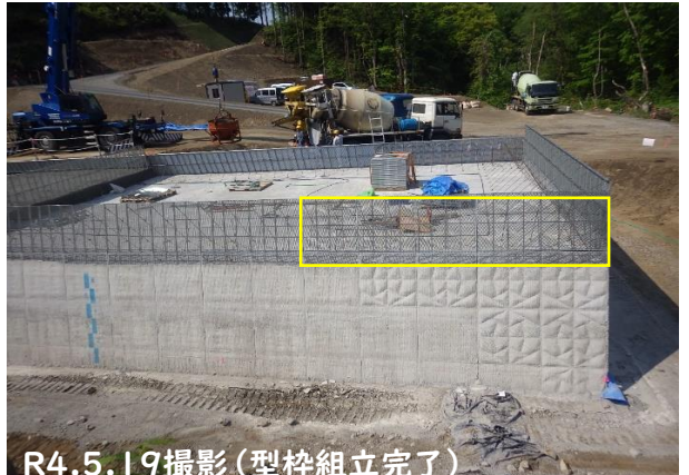
R4.5.19撮影(型枠組立完了)

下の写真が本体工で使用している型枠です。近年残存型枠が普及してきました。残存型枠は名前のとおり組立てた型枠を打設後に取り外す必要のない型枠のことをいいます。残存型枠にもいろいろあり今回現場で使用する型枠はデコメッシュという製品の型枠です。このデコメッシュは1枚当たり(1.0m×1.0m)約8kgと軽量でタイプも石模様とフラットの2種類あり現場ではこの2種類を組み合わせながら型枠の組立作業を行っています。