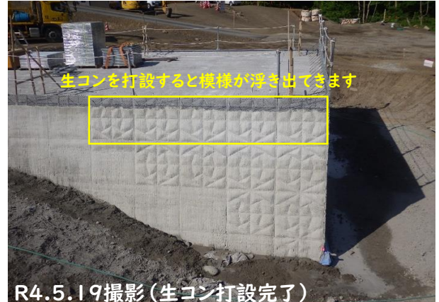
生コンを打設すると模様が浮き出てきます