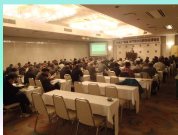
真剣な面持ちで講習会に参加する観測員

講習会では、大雨によるゲート操作や毎月の点検時の留意点、水門等の補修の状況に関する説明のほか、水門を新設している工事現場において、構造等に関する現地見学が実施されました。