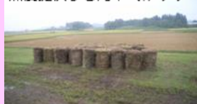
無償提供する刈草 (イメージ)