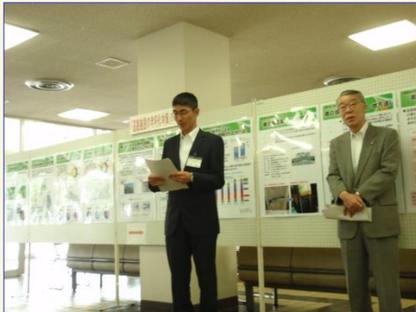
「維持・管理していくことの重要性を知って頂く機会にしてほしいと話す湯沢河川国道事務所長。」

高度経済成長期に集中的に整備された多くの橋梁やトンネルなどの道路インフラが今後急速に高齢化し、老朽化が進行します。計画的に修繕や更新を行わなければ、将来大きな負担が生じることとなるばかりか、安心・安全な社会生活に支障を来す恐れがあります。このため国、県、市町村、高速道路会社からなる秋田県道路メンテナンス会議を発足し、連携して道路施設の老朽化対策に取り組んでいます。その一環として、現在、県内の道の駅にてパネル展を開催しておりますが、予てより、各種施設の保全・老朽化対応等々で連携を図っておりました大仙市役所において、現状や課題等を広く皆様にご紹介することを目的にパネル展を開催しております。