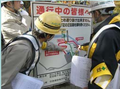
八幡平山系先達川砂防堰堤改良外 工事用道路工事

今回のパトロール結果及び討議での内容をもとに、各現場における今後の安全対策の徹底に努めてもらいたいと思います。