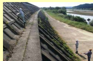
高水護岸の変状や損傷状況がないか確認