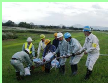
水防工法の練習(木流し工法)