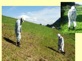
専用の工具を堤防へ貫入し空洞化がないか調査