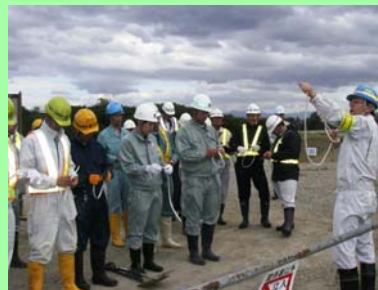
講師のもとロープワークの練習

防災エキスパートを講師に招き、水防工法の基本となるロープワークと土のう作り、そして木流し工法、月の輪工法の水防工法など、有事に備えた実践的な訓練が行われました。