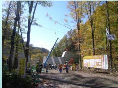
八幡平山系先達川第2砂防堰堤外工事