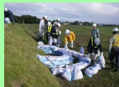
水防工法の演習(月の輪工法)