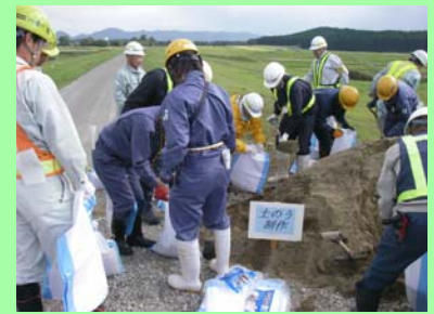
土のうを作っています