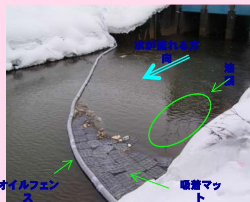
オイルフェンス設置後