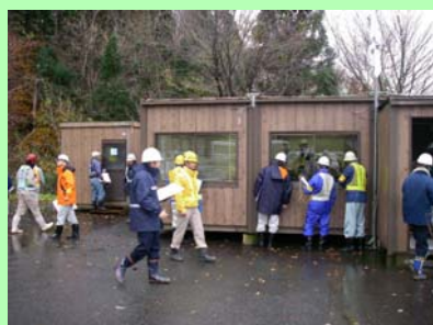
現場事務所の点検の様子