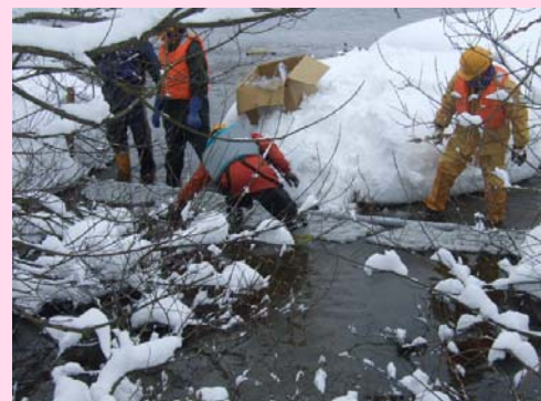
オイルフェンス、吸着マットの設置状況

このような事故を防ぐためには、日頃のホームタンクの管理や給油作業など、油類の取扱いには十分に注意してください。万が一、事故を起こしてしまったら、発見した時は、お近くの国や県の機関、市役所、消防署、警察署等までご連絡をお願いします。