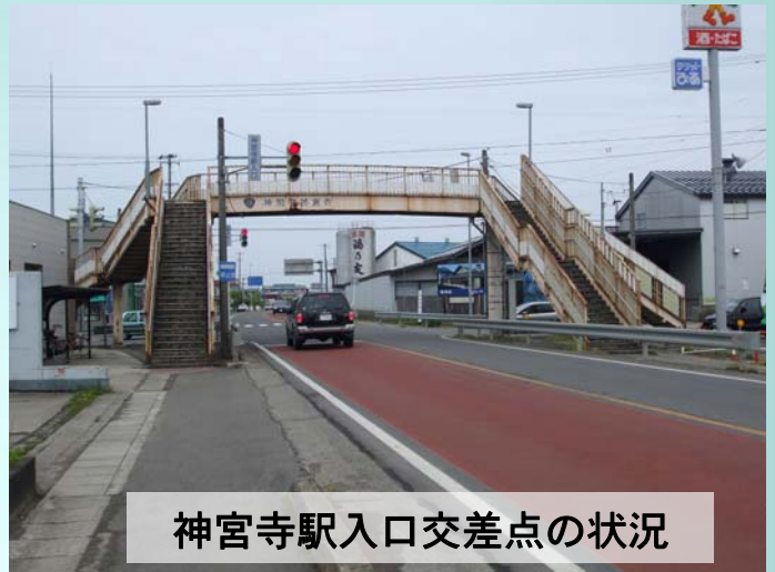
神宮寺駅入口交差点の状況