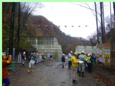
工事現場の点検の様子

今回のパトロール結果や講話をもとに、各現場における今後の安全対策の徹底に努めてもらいたいと思います。