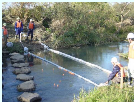
オイルフェンス設置の様子