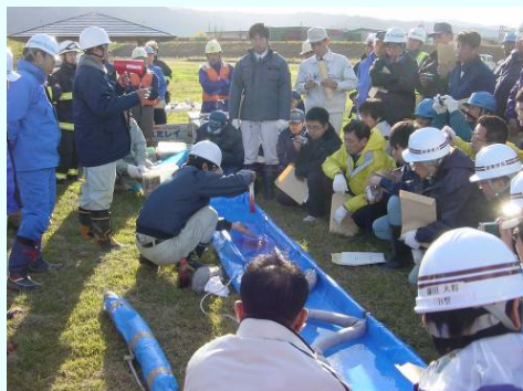
油事故対応時の説明の様子

油流出事故を起こした場合、油回収作業にかかった費用が原因者の負担になりますので、日頃からの注意をお願いします。