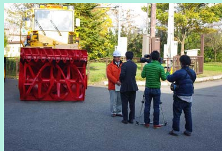
テレビの取材を受ける出張所長