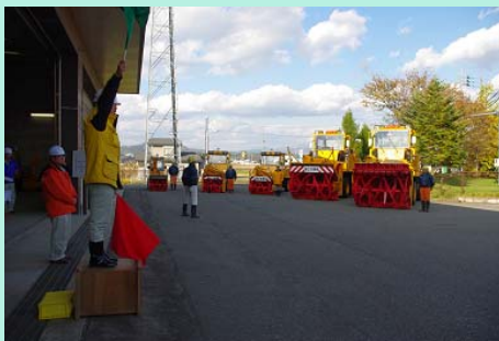
技術係長の号令で「出動」