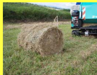
円筒形にした刈草の様子