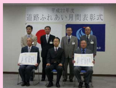
湯沢河川国道事務所での表彰式

大曲国道維持出張所では、ボランティアで道路花壇の管理や、道路清掃・草刈りなどの道路愛護にご協力いただける方を募集しております。興味のある方は気軽に、大曲国道維持出張所にご相談ください。