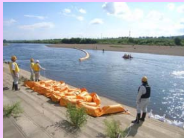
オイルフェンス設置の様子

油流出事故を起こした場合、油回収作業にかかった費用が原因者の負担になりますので、日頃からの注意をお願いします。