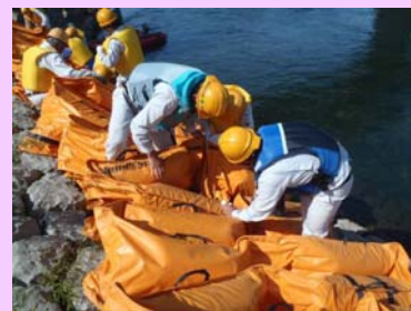
オイルフェンス組み立ての様子