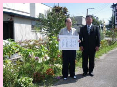
大曲国道維持出張所長から賞状伝達