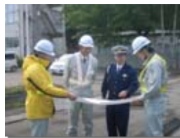
↑↓ 交通安全点検の様子