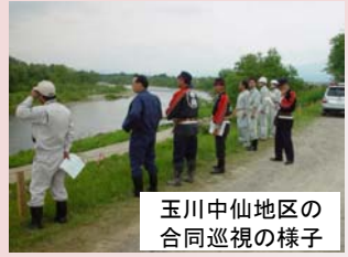
玉川中仙地区の合同巡視の様子

■大曲出張所 大曲国道維持管理担当 〒014-0054 大仙市大曲金谷町25-40 (雄物川の維持管理担当) TEL 0187-63-3340 ■大曲国道維持出張所 大曲国道維持出張所 〒014-0067 大仙市飯田宇大道端128 (国道13号の維持管理担当) TEL 0187-63-2157 ■監督官詰所 大曲監督官詰所 〒014-0067 大仙市飯田宇大道端128 (大曲・神宮寺バイパス担当) TEL 0187-63-4051