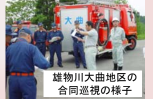
雄物川大曲地区の合同巡視の様子

5月19日(月)、洪水の危険性が高まる梅雨の時季を前に、雄物川上流重要水防箇所巡視を仙北地域振興局・大仙市・大曲仙北広域市町村圏組合消防本部と合同で行いました。