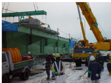
↑ 現場パトロールの様子 ↑