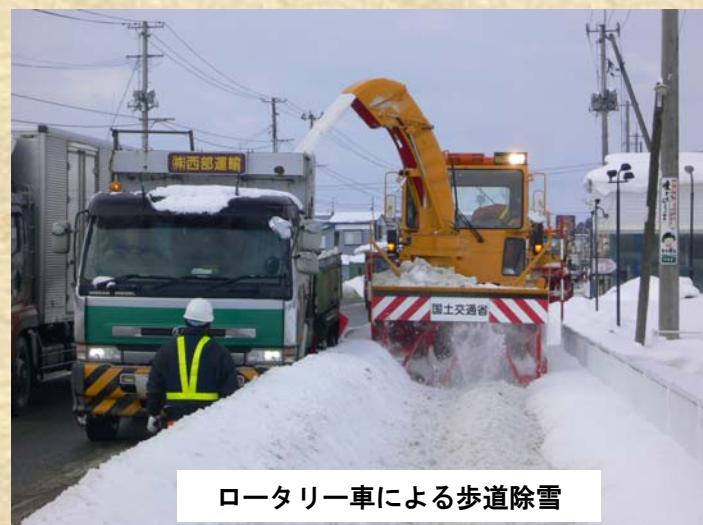
ロータリー車による歩道除雪

お近くの道路で、除雪機械を見かけることもありますが、安全のため除雪機械には近づかないようご理解とご協力をお願い致します。